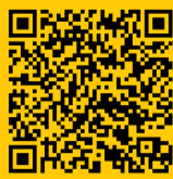
info

degli Istituti Scolastici della provincia di Treviso